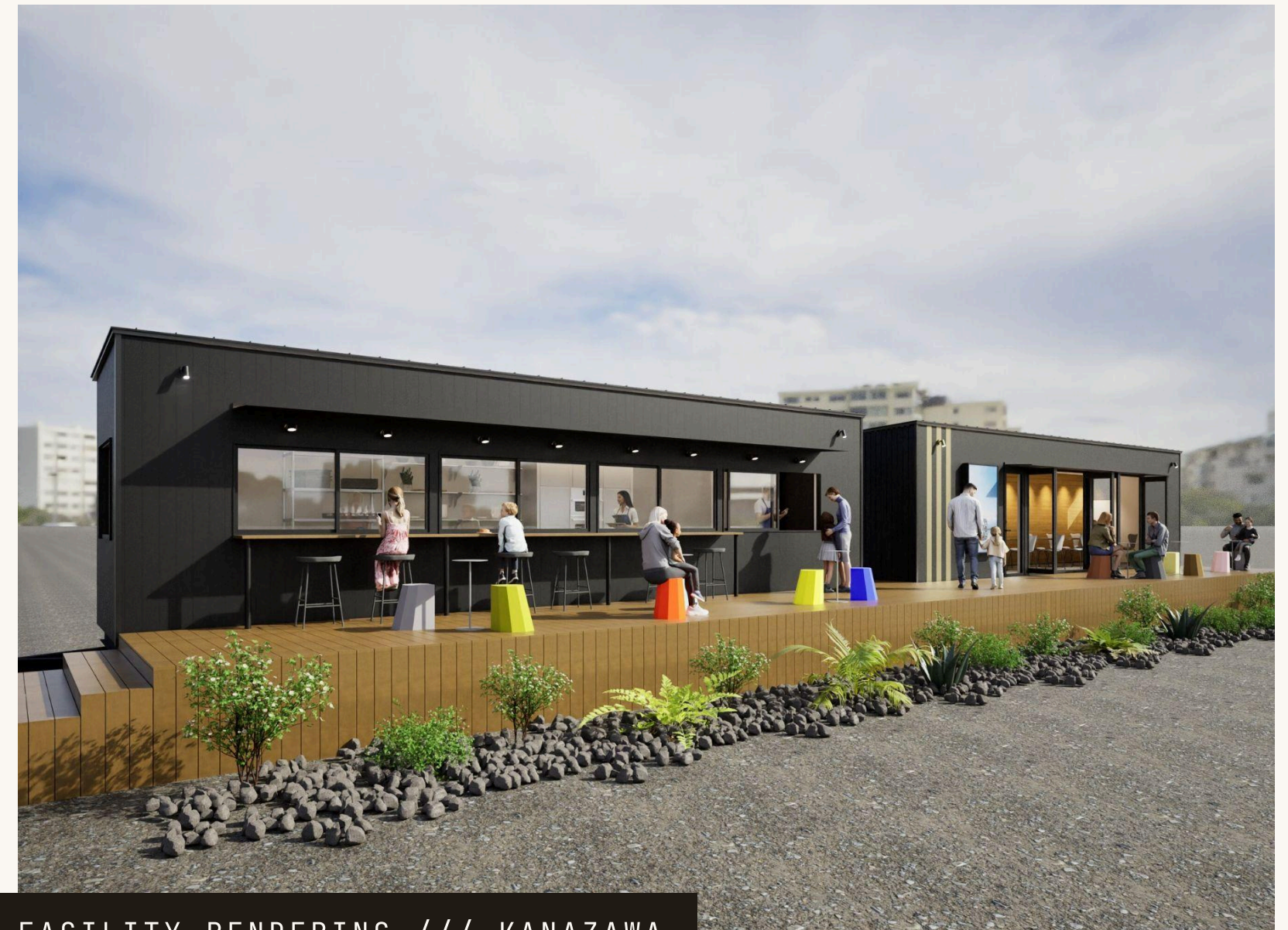
FACILITY RENDERING /// KANAZAWA

家でも職場でもない「サードプレイス」として、 食・遊び・旅が交差し、地元と来場者をつなぐ新しい賑わいをつくります。